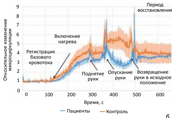
Графики зависимости средних стандартных (а) и относительных (б) значений индекса микроциркуляции от времени при выполнении постурально-тепловой пробы на руке в контрольной и исследуемой группах